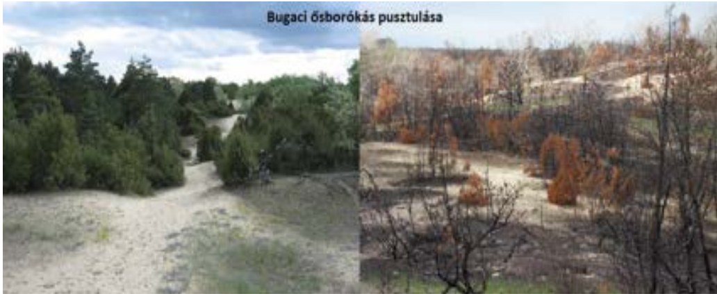
Bugac, 2012. május