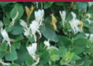
Lonicera Japonica 'Halliana'