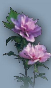
Hibiscus Syriacus 'Ardens'