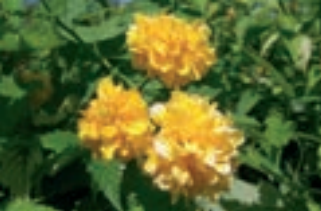
Kerria Japonica 'Pleniflora'