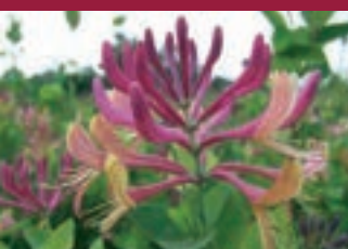
Lonicera Periclymenum 'Belgica Select'