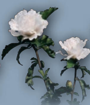
Hibiscus Syriacus 'Jeanne d'Arc'