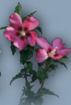
Hibiscus Syriacus 'Woodbridge'