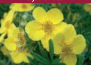
Potentilla Fruticosa 'Goldfinger'