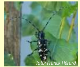
Simahátú csillagoscincér Anoplophora glabripennis

A karantén károsítók gazdanövényei: számos lombhullató fás növény, f ként: