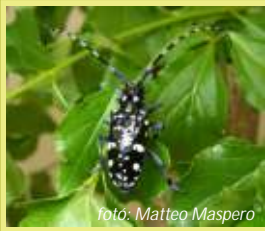
Szemcsés hátú csillagoscincér Anoplophora chinensis