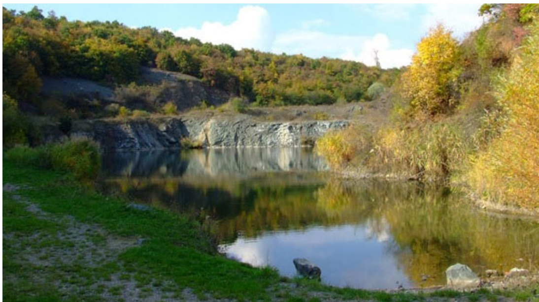
Forrás: Minden, ami Egert: Egerbakta bányató