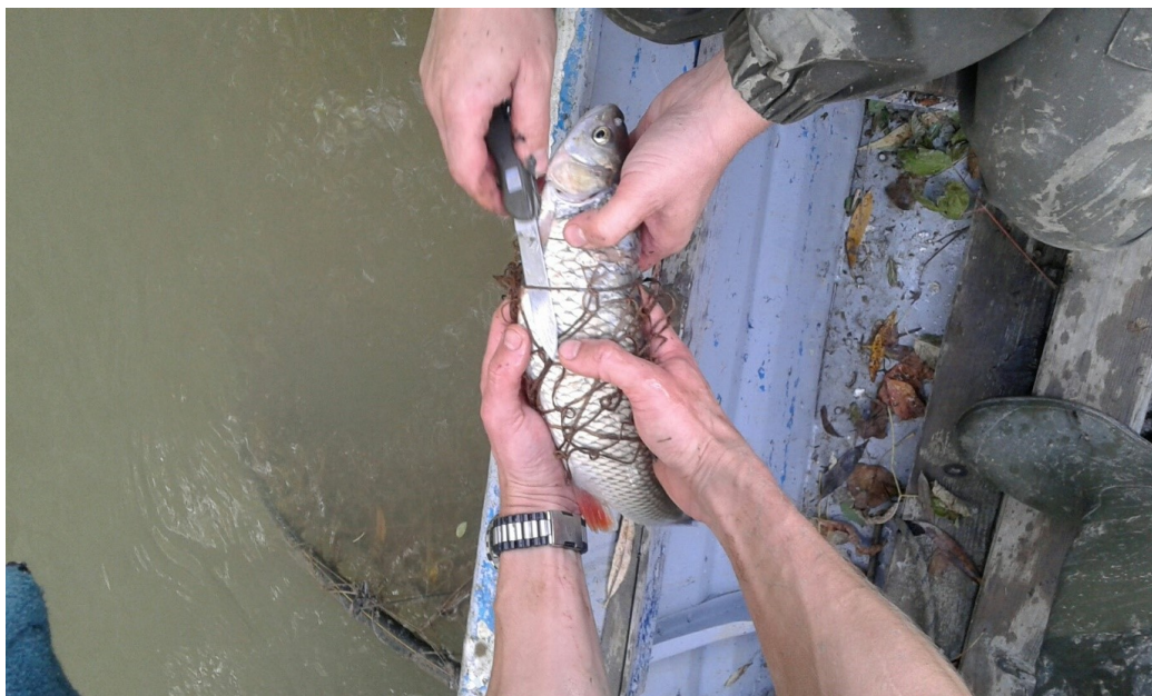
a halóba akadt hal kiszabadítása