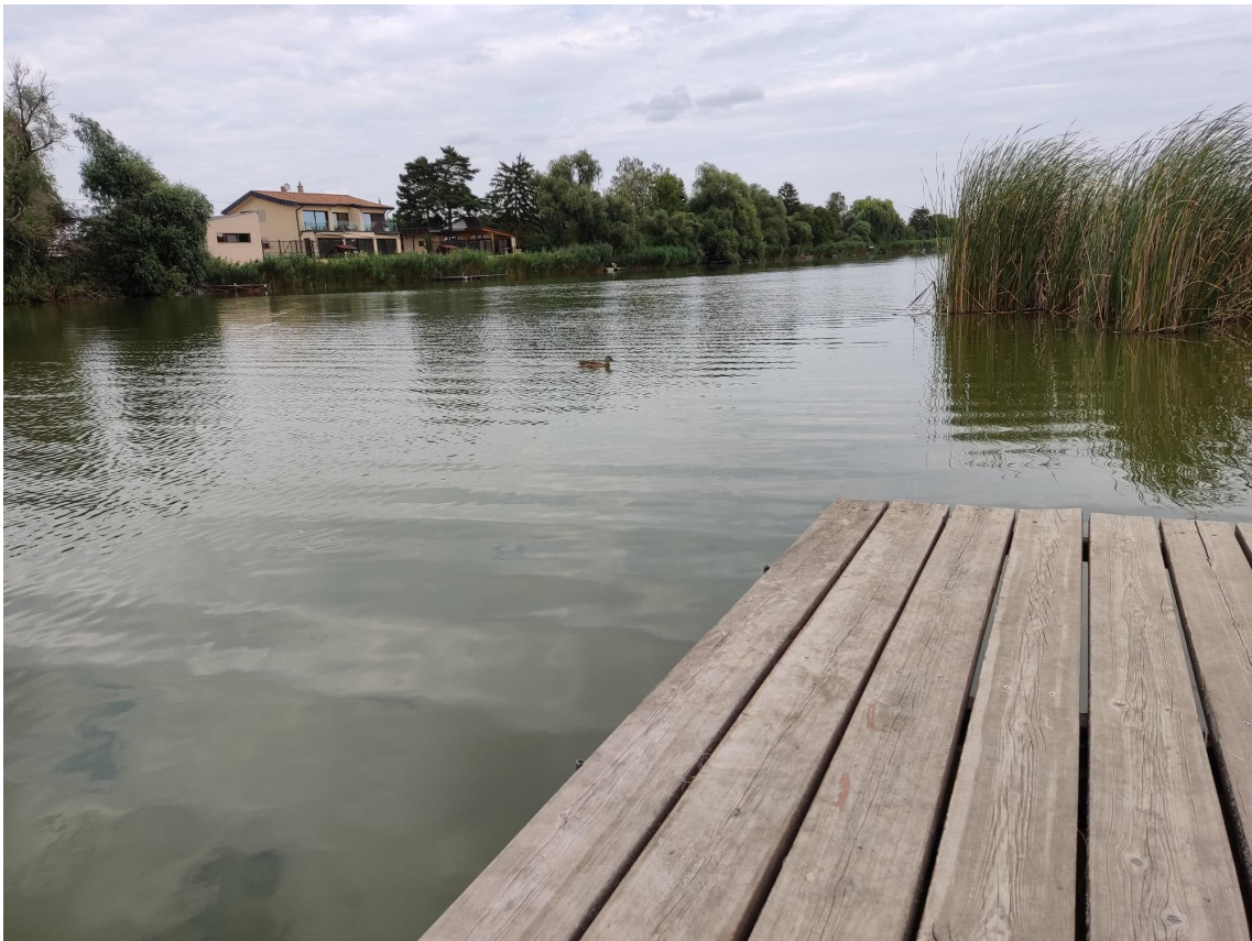
Alcsi Szigeti Holt Tisza