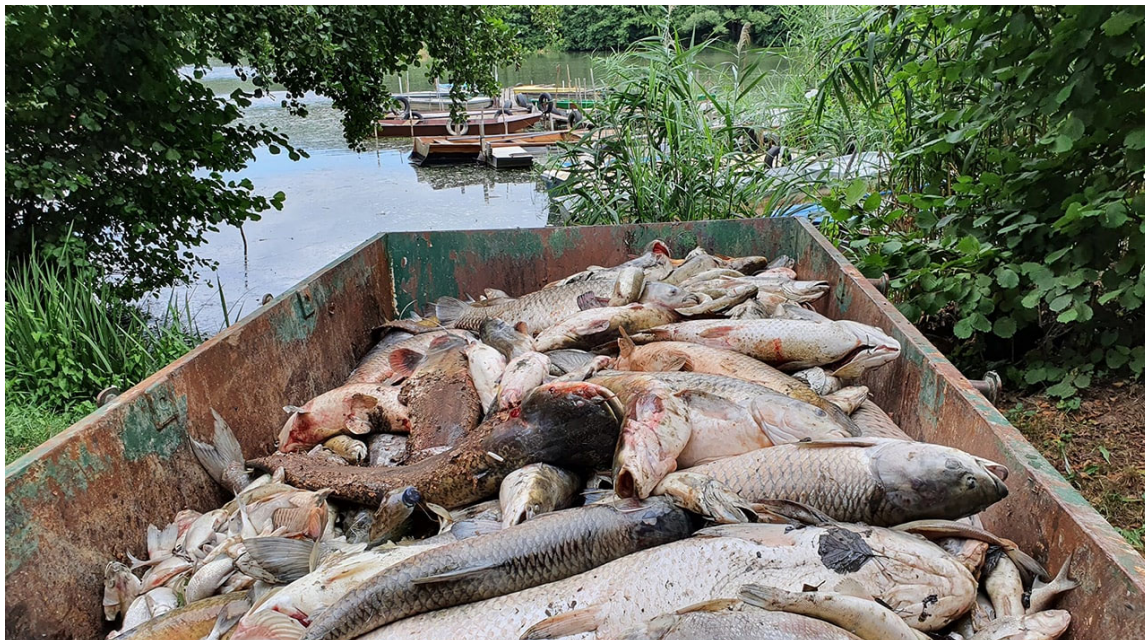
Tömeges halpusztulás Orfűn

A kijelölt halgazdálkodásra jogosult igazolt költségeit a nyilvántartott halgazdálkodási vízterület halgazdálkodási jogosultja, halgazdálkodásra jogosult hiányában a halgazdálkodási hatóság az elszámolás elfogadását követő 30. napig téríti meg.