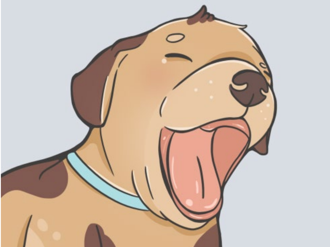
1. ábra: 0-3 hetes kor

Ha a kutyának egy foga sem látható, nagy valószínűséggel nem töltötte be a 3 hetes életkort. Kizárólag az anyakutyával együtt mozgatható 5 .