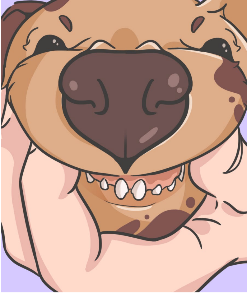
7. ábra: 15-17 hetes kor - az első maradó metszőfogak

A maradó fogak közül a felső metszőfogak kihasadása a legfeltűnőbb , amelyet azonban a legtöbb kutyafajtában a felső első előzáfog megelőzhet.