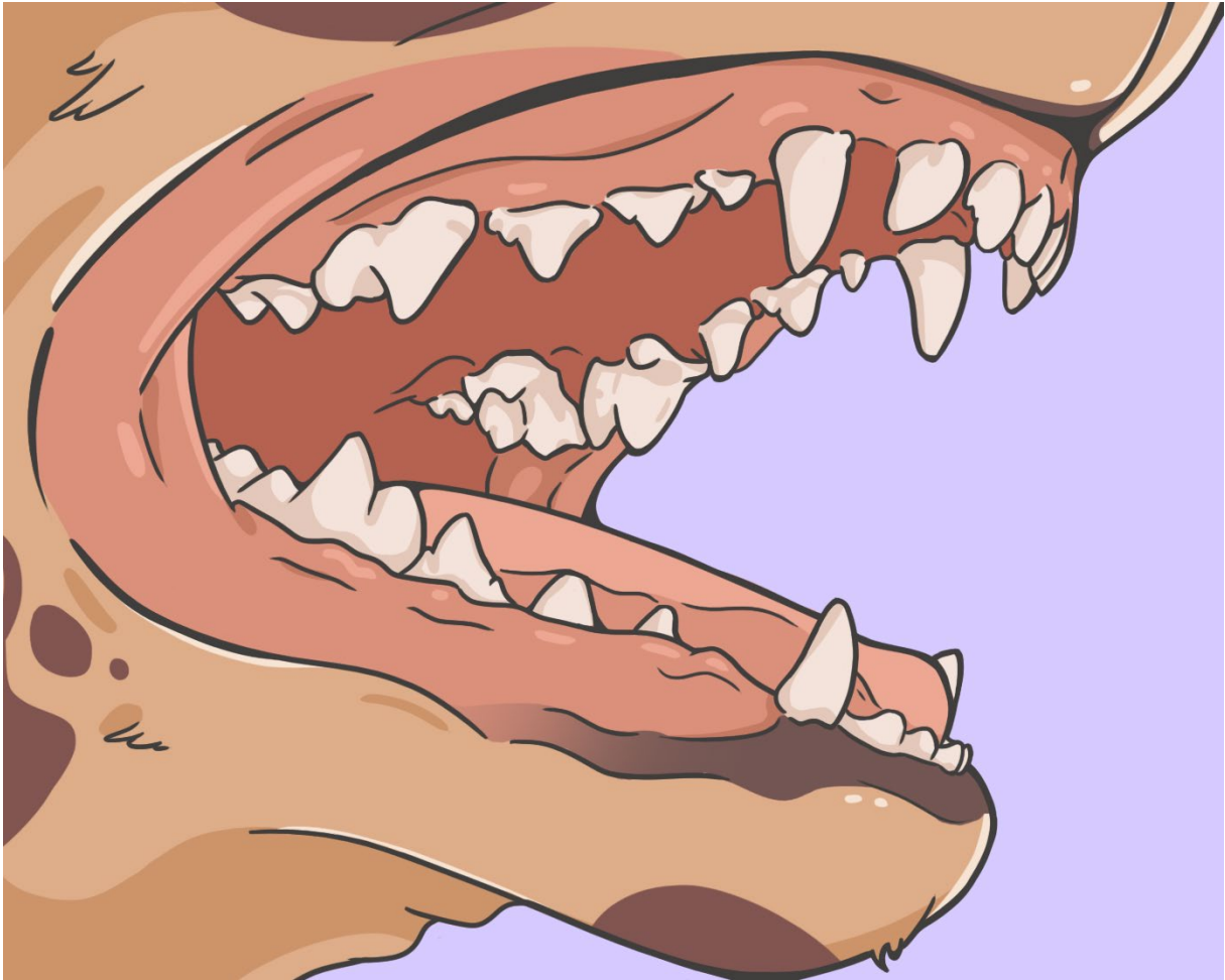
8. ábra: 6-12 hónapos kor

A kutya minden tejfogát maradó fogra váltotta, a maradó fogazata 12 metszőfogból, 4 szemfogból, 16 előzáfogból és 10 zápfogból áll.