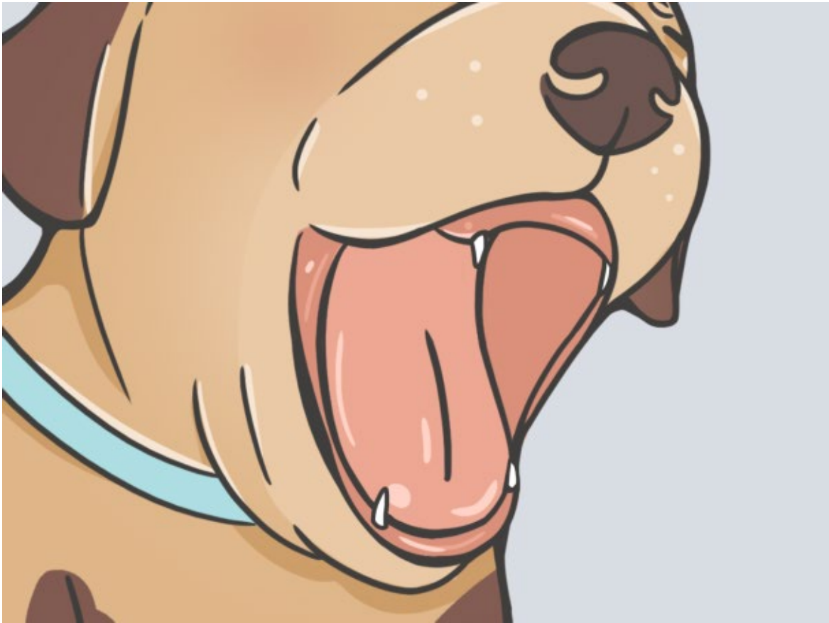
2. ábra: 3-4 hetes kor

Körülbelül 3 hetes korban kezdődik a tejfogak kihasadása, elsőként a szemfogakkal. Kizárólag az anyakutyával együtt mozgatható 5 . Amennyiben egy úton lévő szállítmány ellenőrzése során látnak ilyen fogazatú, anyaállat nélküli kölyköt, úgy a hatósági intézkedésen túl az állatkínzás (bűncselekmény) gyanúja is felmerül, melynek kivizsgálása a rendőrség/nyomozó hatóság feladata.