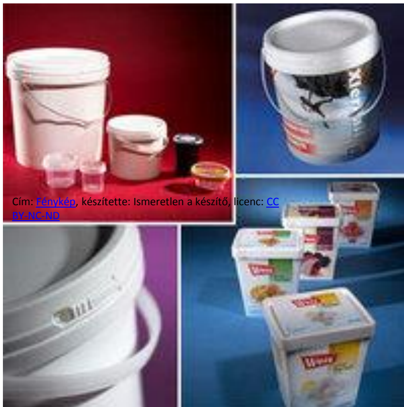
Cím: Fénykép , készítette: Ismeretlen a készítő, licenc: CC BY-NC-ND