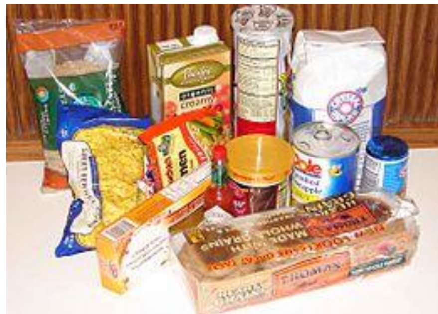
Cím: Fénykép , készítette: Ismeretlen a készítő, licenc: CC BY-SA