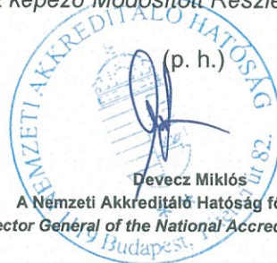
Devecz Miklós A Nemzeti Akkreditáló Hatóság főigazgatója Director General of the National Accreditation Authority

Záradék: az okirat kiállítva az AI-00125-3/2017 iktatószámú határozat és annak mellékletét képező Módosított Részletező okirat kijavítása miatt.